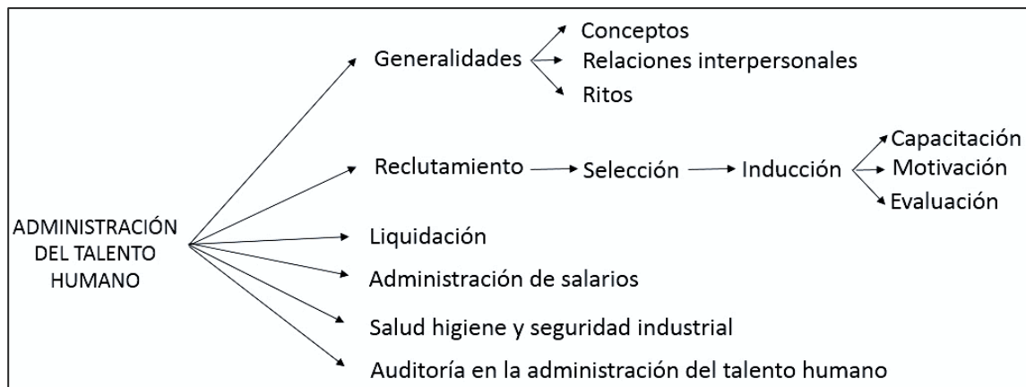
Figura#3: Administración del Talento Humano.

Otro aspecto de gran importancia es la evaluación de desempeño según lo indicado por Bedoya (2003) “la nueva concepción de los recursos humanos y el establecimiento de un sistema de gestión de evaluación de su desempeño incidirá en el desarrollo de las empresas en un entorno de alta competitividad” (pág. 171).