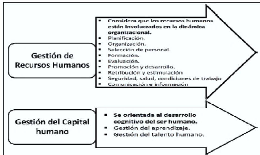
Figura#2: Gestión de Recursos humanos vs, Capital Humano.

Es decir, la evaluación le permite conocer al empresario el rendimiento de sus trabajadores, determinando el grado en el que desempeña sus funciones, con la finalidad de ofrecer retroalimentación o diseñando estrategias que le permitan utilizar correctamente ese capital intangible en función a la mejora de los resultados de la empresa y de la misma manera fomentando su desarrollo personal.